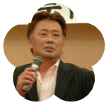
梶原高等学校 PTA 会長