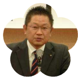
高知追手前高等 学校 PTA 会長