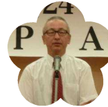
高知南中・高等 学校 PTA 会長