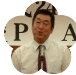
高知東高等学校 PTA 会長