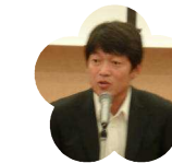
中村中・高等 学校 PTA 会長