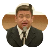
伊野商業高等学校 PTA 会長