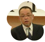
幡多農業高等 学校 PTA 会長