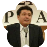
岡豊高等学校 PTA 会長