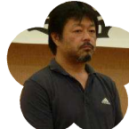
高知ろう学校 PTA 会長