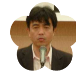
大方高等学校 PTA 会長