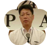
嶺北高等学校 PTA 会長