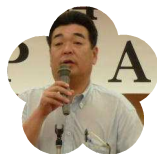
高知小津高等 学校 PTA 会長