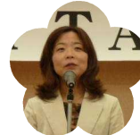
山田高等学校 PTA 会長