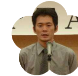
高知工業高等学校 PTA 会長