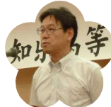
安芸中・高等 学校 PTA 会長