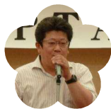
高知丸の内高等 学校 PTA 会長