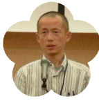
西土佐分校 PTA 会長