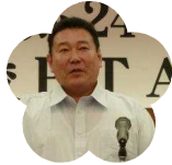
中芸高等学校 PTA 会長