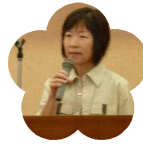
大月分校 PTA 会長