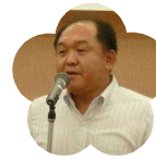
清水高等学校 PTA 会長