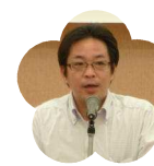
須崎高等学校 PTA 会長