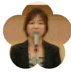
宿毛工業高等 学校 PTA 会長