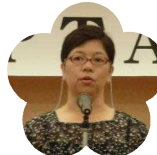
高知農業高等 学校 PTA 会長