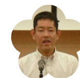
高岡高等学校 PTA 会長