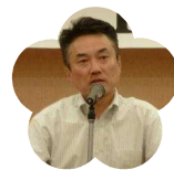
高知西高等学校 学校 PTA 会長