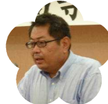
城山高等学校 PTA 会長