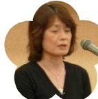
江の口養護学校 PTA 会長