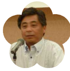
宿毛高校 PTA 会長