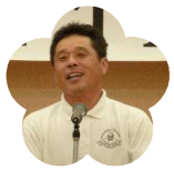
春野高等学校 PTA 会長