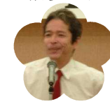
四万十高等学校 PTA 会長