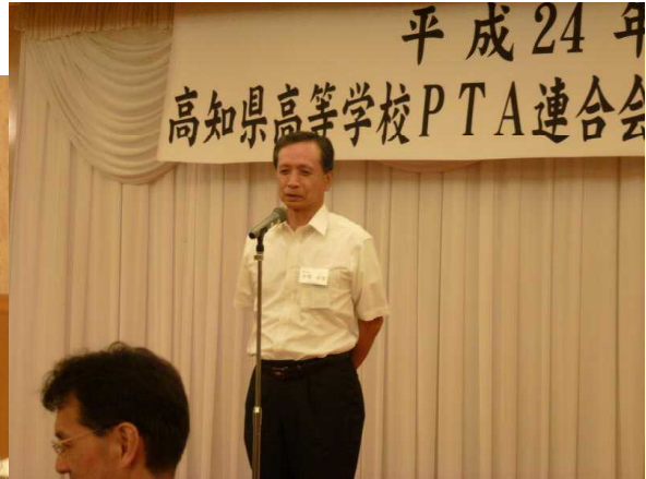
高知県教育長 中澤 卓史 様