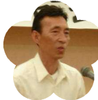
盲学校 PTA 会長