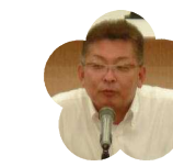
佐川高等学校 PTA 会長