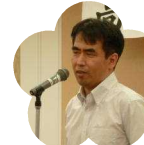
若草養護学校 PTA 会長