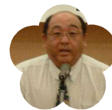
高知商業高等 学校 PTA 会長